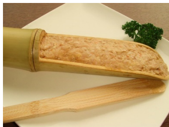
生つくね 500円(税抜き)