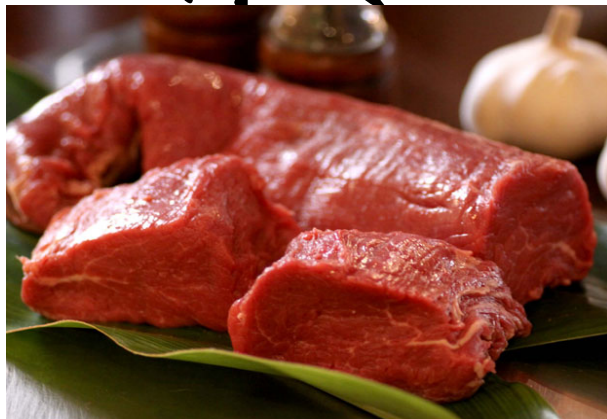
牛ヒレステーキ 880円(税抜き)