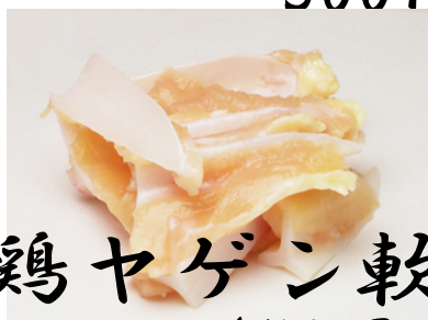
鶏ヤゲン軟骨 450円(税抜き)