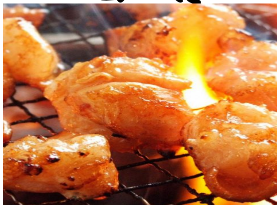
国産丸腸 500円(税抜き)